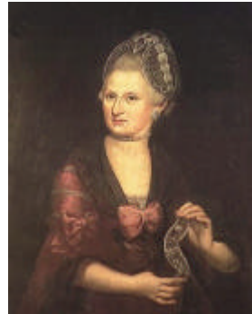
Anna Maria Mozart

Han hade en syster som hette Maria Anna men kallades Nannerl. Hon var 4 år äldre än Wolfgang. Nannerl fick börja spela piano när hon var 7 år gammal. Men det skulle inte ta lång tid innan Wolfgang också spelade piano. Redan som treåring fick han vara med när systemen undervisades. När han endast var 4 år började hans pappa på lek lära honom några musikstycken. Wolfgang visade redan då att han var ett underbarn genom att snabbt lära in musikstyckena. Det tog Mozart endast en timme att lära in en menuett. Leopold insåg att han skulle ägna mer tid åt barnens musicerande än åt sin egen musik eftersom de hade så stora musikaliska gåvor. I ett av sina brev kallade han barnen ”underverk som Gud har låtit födas i Salzburg”.