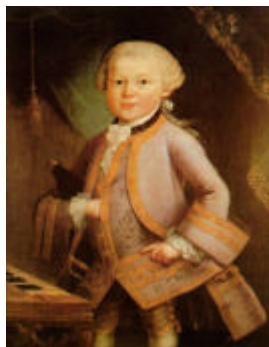
Wolfgang Amadeuz Mozart (som liten)