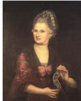
Anna Maria Mozart

Han hade en syster som hette Maria Anna men kallades Nannerl. Hon var 4 år äldre än Wolfgang. Nannerl fick börja spela piano när hon var 7 år gammal. Men det skulle inte ta lång tid innan Wolfgang också spelade piano. Redan som treåring fick han vara med när systemen undervisades. När han endast var 4 år började hans pappa på lek lära honom några musikstycken. Wolfgang visade redan då att han var ett underbarn genom att snabbt lära in musikstyckena. Det tog Mozart endast en timme att lära in en menuett. Leopold insåg att han skulle ägna mer tid åt barnens musicerande än åt sin egen musik eftersom de hade så stora musikaliska gåvor. I ett av sina brev kallade han barnen ”underverk som Gud har låtit födas i Salzburg”.