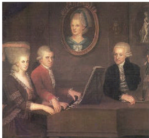
Maria Anna (Nannerl), Wolfgang Amadeus och Leopold Mozart

När Mozart kom hem togs han emot på bästa sätt. Familjen ville att han skulle stanna i Salzburg. Han blev åter anställd hos greve Colloredo. Leopold och Wolfgang väntade på att han skulle få en stor operabeställning. Den kom 1780 från kurfursten i München som ville ha en opera seria som skulle uppföras under karnevalsäsongen 1781. 13