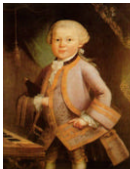
Wolfgang Amadeuz Mozart (som liten)